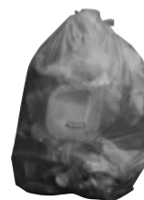
in sacchi di plastica