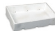
cassetta polistirolo (pesce)