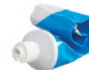
tubo per creme ecc.