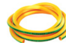
tubo in gomma