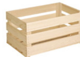
cassette in legno